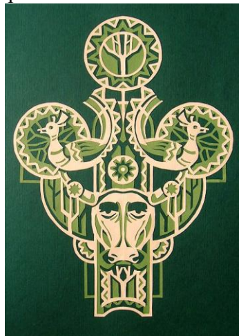
Рис.6. П. Порицький «Подих віків»

Студентам пропонуються творчі завдання привнести самобутнє, оригінальне у вирішенні теми, композиції роботи (Рис.5,6).