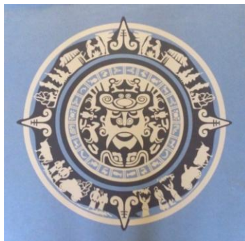
Рис. 4. Ю. Вінчук «Знаки»

Для розвитку наявних умінь і подальшому перетворенню цих умінь у навички студентам пропонується використати як елементи для орнаментальної композиції графічні зображення природних об'єктів, попередньо стилізувавши їх.