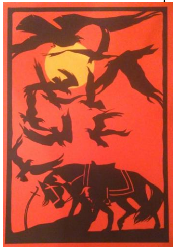
Рис.5. О. Юр'єв «Берестечко»

5. За допомогою аналізу і вивчення конкретної форми створення шляхом синтезу нової форми на основі їх початкової характеристики.