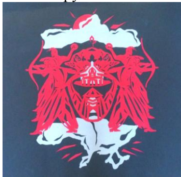
Рис. 3. А. Бурдуковська «Козацька доба»

елементи зрівноважені між собою і з форматом композиції, контраст – активне зорове протиставлення розмірів, форм, тону, кольору, і нюанс - ледь помітна відмінність одного елемента чи кольору .