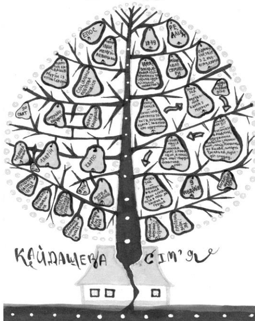
Рис. 2. Скрайб до теми «Повість «Кайдашева сім'я» Івана Нечуя-Левицького»