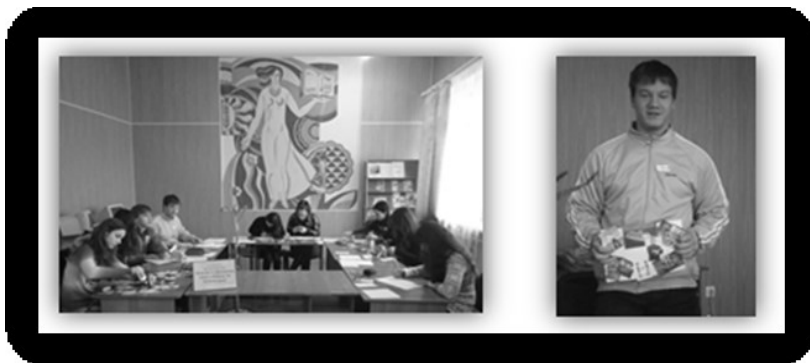
Рис. 3. Засідання гуртка з економіки, створення «Карт бажань» та їх презентація

Необхідною умовою досягнення поставлених цілей є активна діяльність людини, рушійною силою якої слугує мотивація. Серед запроваджуваних в освітній процес БЕГК БДПУ способів підвищення мотивації молоді до дій найбільш ефективними визначено такі: створення « Карти бажань » та вивчення історій кар'єрного росту відомих успішних людей України і світу. Зокрема, «Карти бажань» вихованці створюють як у коледжі (Рис. 3), так і самостійно у позаурочній діяльності.