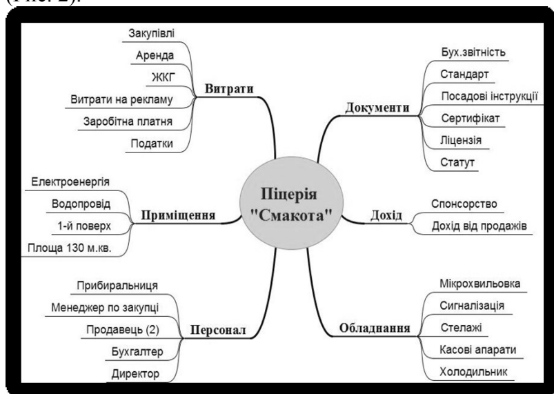
Рис. 2. Приклад інтелект-карти «Мій бізнес»

У межах використання цієї технології учні й студенти складають та аналізують бюджет (особистий, сімейний, бізнесу) на день, тиждень, місяць, рік. Таким чином, набувають умінь із первинної бухгалтерії, навчаються раціонально розподіляти прибуток, знаходити джерела й способи поповнення бюджету тощо. За допомогою «інтелект-карт» вихованці планують свій майбутній бізнес (Рис. 2).