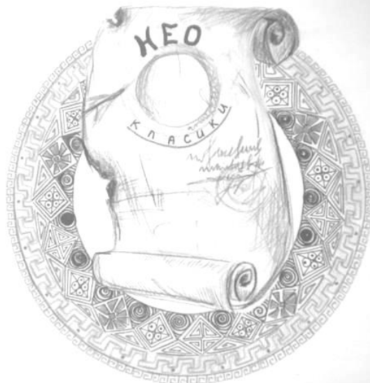
Рис. 2. Інтермедіальний контент, створений студентами («Неокласики в українській літературі»)