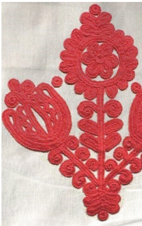
Рисунок 4 – Автор Пекарська Діана

Культурне засвоєння технік та матеріалів попередніх століть, поєднання їх із розвитком самобутнього українського орнаментально-сюжетного змісту, колористики є підґрунтям для сучасного мистецтва вишивання. З цією метою у змісті дисципліни «Робота в матеріалі» передбачено виконання завдань, що включають вивчення традиційних швів (як України, так й інших народів світу), на цій основі створення композицій рослинного характеру та виконання їх в матеріалі. Результати виконання практичної роботи представлено на рисунках 4-6.