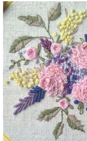
Рисунок 6 – Автор Булік Анастасія