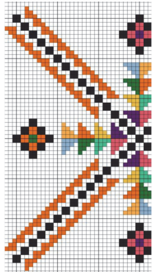
Рисунок 3 – Автор Рябець Катерина

Для створення орнаментальних композицій майбутні художники (бакалаври) декоративного мистецтва використовують як традиційні способи виконання (ватман, олівці, ручки, фарби), так й сучасні інформаційно-комп'ютерні засоби. Роботи, представлені на рис. 1-3, виконані за допомогою комп'ютерної програми Pattern Maker.