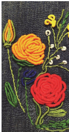
Рисунок 5 – Автор Пекарська Діана