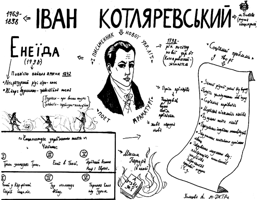
Рис. 4. Логічна схема вивчення теми «Творчість Івана Котляревського»

Значний ефект має застосування прийомів мнемотехніки під час аналізу ідейно-художнього змісту літературних творів, особливо, якщо доводиться розглядати великий за обсягом твір або велику кількість літературних творів за невеликий проміжок часу. Студентам мистецького коледжу можна запропонувати створити до ідейно-художнього змісту літературних творів узагальнювальні логічні схеми, у яких поєднувалися б теоретичний матеріал та зміст твору (Рис. 4).