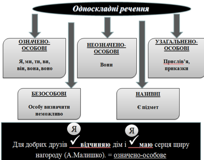
Рис. 3. Логічна схема «Види односкладних речень»

Як бачимо, теоретичний матеріал з означеної теми – досить об’ємний: студентам необхідно засвоїти назви видів односкладних речень, значення дії або виконавця, способи вираження головного члена речення; навчитися правильно визначати види односкладних речень. Тому доцільним, на нашу думку, є використання прийомів мнотехніки та застосування образно-асоціативних малюнків, логічних схем (Рис.3).